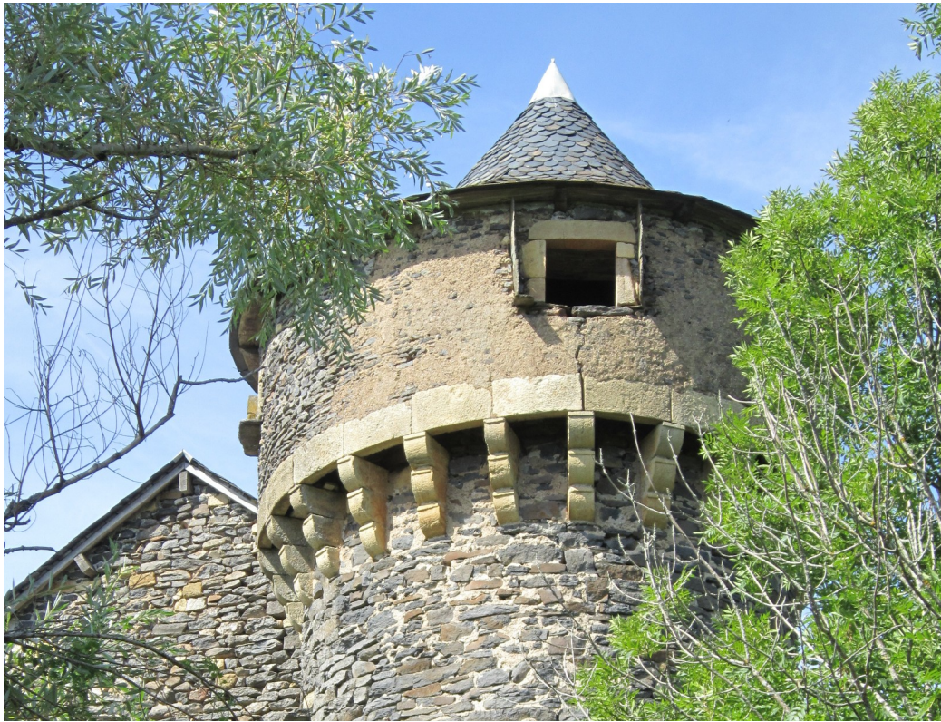
Château de la Salle - détail tour sud avec mâchicoulis