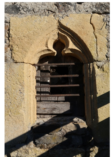
petite fenêtre à motif trilobé