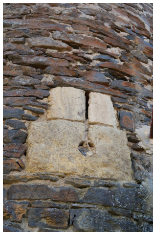
archère canonnrière (tour Sud)